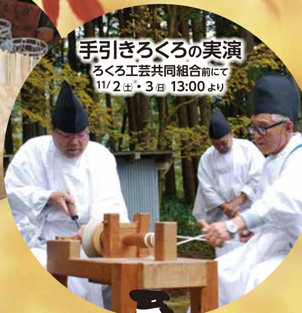
手引きろくろの実演 ろくろ工芸共同組合にて 11/2(土)・3(日) 13:00より