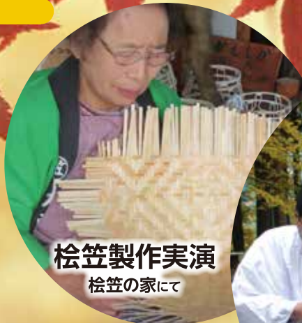
桧笠製作実演 桧笠の家にて