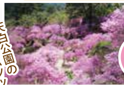
天白公園の ミツバツツジ

Ask us anything about sightseeing in Nagiso Town!